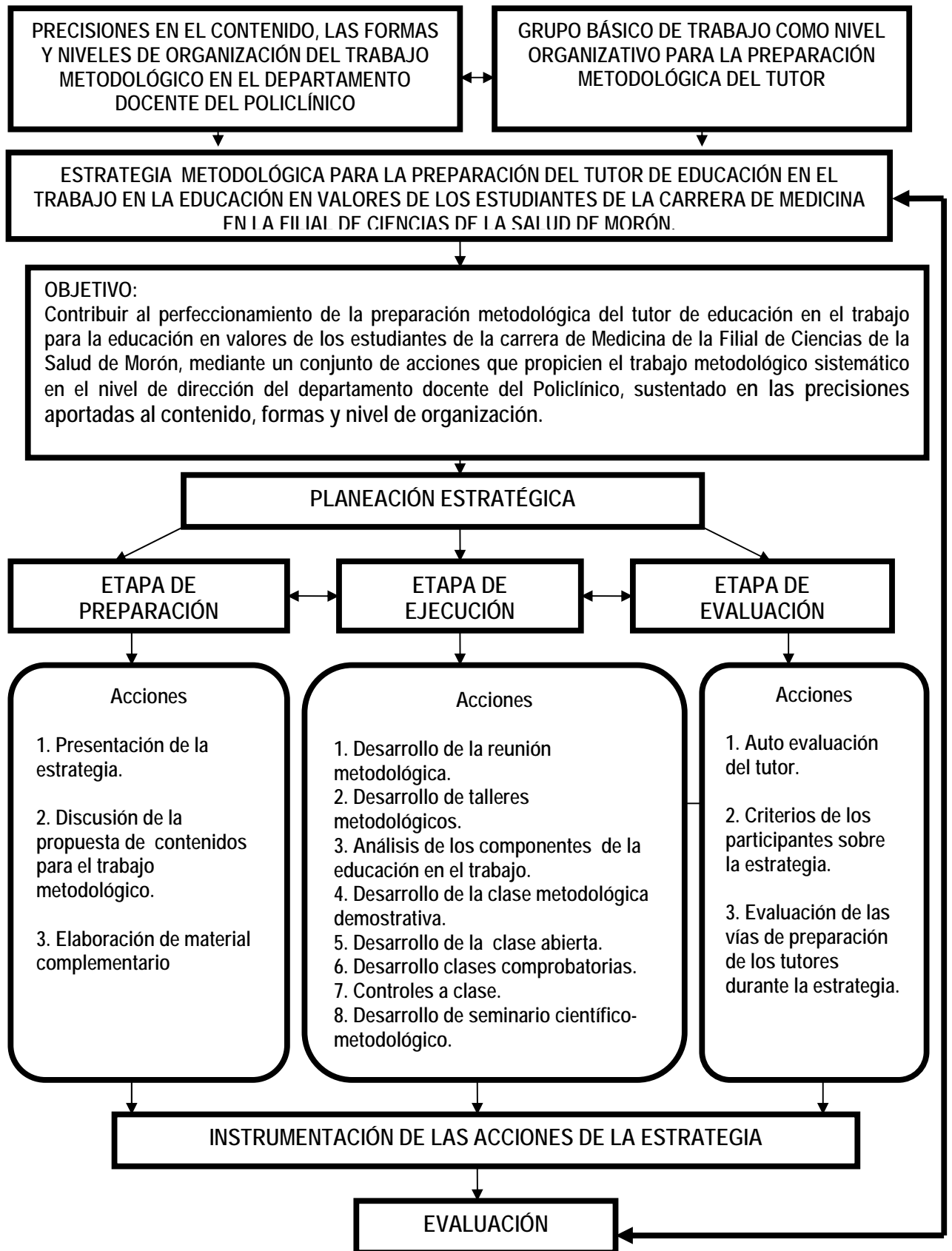
Figura 1 Representación gráfica de la estrategia metodológica.